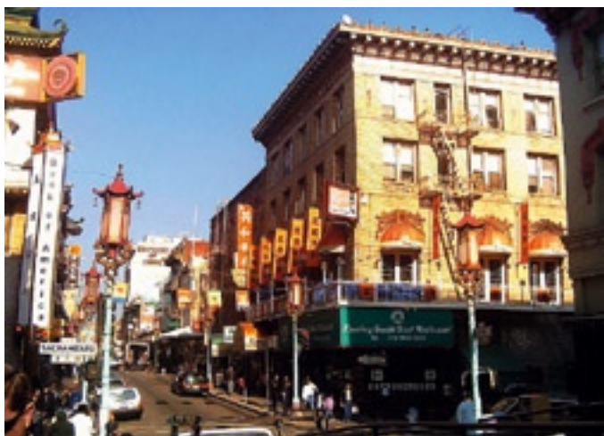
Chinatown San Francisco

Historisch verwijst de term naar de vrijgezelligengemeenschap van Chinese mannen (de bachelor society), die vanaf het einde van de 18de eeuw tot 1952 in de VS verbleven. Het fenomeen van Chinatown als Chinese buurt is het gevolg van een raciaal uitsluitingsbeleid. Chinese arbeiders en avonturiers hadden toen geen recht op het Amerikaans burgerschap. Gedurende zes decennia werd immigratie van Chinese arbeiders aan banden gelegd, alsook familiehereniging en gemengde huwelijken. De verhouding man/vrouw in 1890 was 21/1. Vanaf 1910 tot 1940 weken de meeste Chinezen uit naar de steden, waar ze gedwongen werden tot het kleine ondernemerschap zoals de restaurant- en de wasserijsector. Na de tweede wereldoorlog ontwikkelden ze zich tot immigranten-enclaves, waar naast alleenstaande mannen ook families zich vestigden. Door