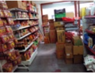
Sun Kwon Trading