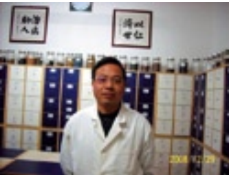
Renji Medical Center

Centraal gelegen in het hart van de stad, tegenover het Centraal Station en de Zoo. Radisson BLU Astrid biedt 247 ruime luxueuze kamers aan, met wireless internet, fitness & health club en parkeergarage. In The Square kunt u genieten van een heerlijk drankje, een snack of gastronomisch diner.