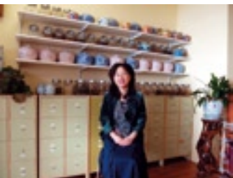
Tao's Acupuncture Center

Sun Wah maakt deel uit van de Rolic Group. Deze brengen elke maand "Rolic News" uit. Een krant met nieuws over mode, technologie, financieel nieuws en cultuur. Diverse Aziatische bedrijven promoten producten in deze krant. De krant is gratis en wordt verspreid in België, Luxemburg en Nederland. Ze is erkend door de Chinese ambassade.