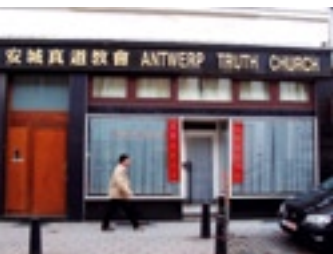
Antwerp Truth Church Belgium

De doelstelling van deze organisatie is om de integratie van de Filippijnse gemeenschap in Antwerpen te bevorderen en de kennis van de Filippijnse cultuur bij Belgen en mensen van andere culturen te verbeteren. De vzw is sinds 2007 actief en organiseert cursussen, culturele activiteiten en workshops. Op 16 mei 2009 organiseerde zij voor de eerste keer een Filippijns feest in Park Spoor Noord onder de naam Flores de Mayo. Het hoogtepunt was een multiculturele bloemenparade.