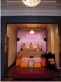
Fo Guang Shan Tempel