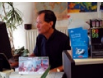
Intimex Travel service