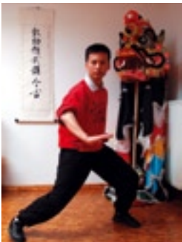
Tith Ngaw Pai

Sinds midden jaren negentig is deze vereniging actief in Antwerpen. Zij organiseert voor de ongeveer 400 Tibetanen in Antwerpen tal van culturele activiteiten. Daarnaast ondersteunt zij haar leden op allerlei vlakken (sociaal, educatief, enz.). Elk jaar zijn er drie speciale momenten: het Tibetaans Nieuwjaar (in februari of maart), de verjaardag van de Daila Lama (6 juli) en de herdenking van de uitreiking van de Nobelprijs voor de vrede aan de Daila Lama (10 december).