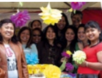
Belgisch Filippijnse Solidariteit