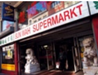
Sun Wah Supermarket

De eigenaars komen van Hong Kong en hebben achttien jaar geleden de winkel geopend. Ze zijn begonnen met de verkoop van diepvriesvoeding voor restaurants maar verkopen nu ook aan particulieren. In hun winkel kunt u allerlei voedsel kopen van China en Zuid-Oost Azië. Hun doelstelling is om hun klanten op de beste manier te bedienen en de best mogelijke producten te leveren.