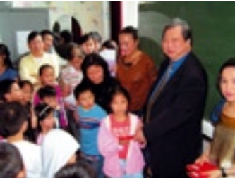
Chinese school van Antwerpen

Er worden lessen Cantonees en Mandarijn (putonghua) gegeven op woensdagnamiddag en zaterdagvoormiddag. De school telt gemiddeld 200 leerlingen, die voornamelijk uit Antwerpen komen, maar ook uit andere provincies zoals Vlaams Brabant, West Vlaanderen, Limburg en zelfs uit Nederland.