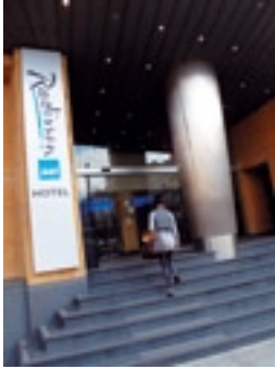
Radisson Blu Astrid Hotel